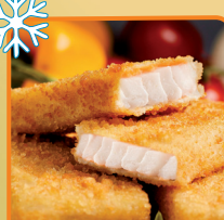
KOSTKA MINTAJ PANIEROWANA 6 kg