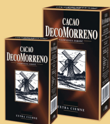
KAKAO 80 g / 150 g