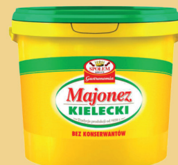
MAJONEZ KIELECKI 5 L