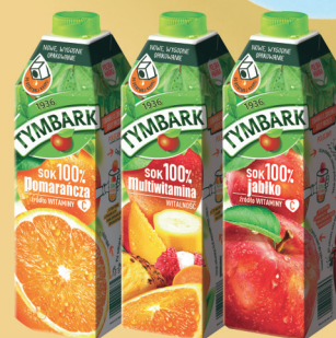
SOK 100% MULTIWITAMINA, JABŁKO, POMARAŃCZA 1 L