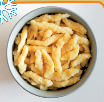
KLUSECZKI W STYLU „SPÄTZLE” 1 kg