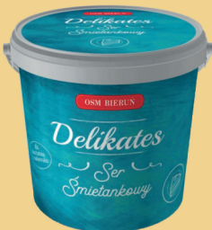
SER ŚMIETANKOWY DELIKATES 1 kg