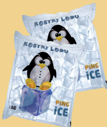
LÓD W KOSTKACH 1 kg / 10 kg