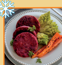
BURGER BURACZKOWY 5 kg