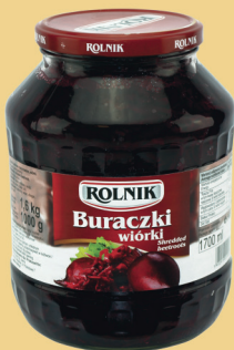
BURACZKI WIÓRKI 1700 ml