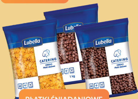
PŁATKI ŚNIADANIOWE 1 kg