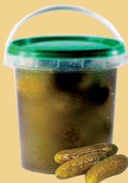
OGÓRKI KISZONE 3 kg