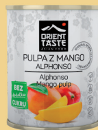
PULPA MANGO 850 ml