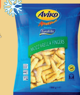
PALUSZKI SEROWE 1 kg