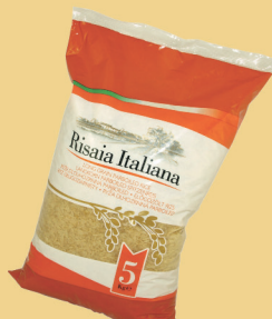
RYŻ PARABOLICZNY 5 kg