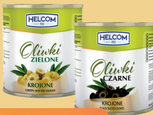
OLIWKI KROJONE ZIEŁONE, CZARNE 3100 ml