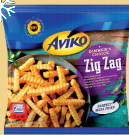
FRYTKI KARBOWANE 450 g

Produkty głęboko mrożone. Szybki czas przyrządzenia.