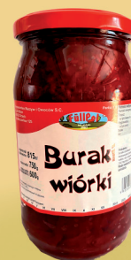
BURAKI WIÓRKI 900 ml

O cenę pytaj swojego Przedstawiciela Handlowego.