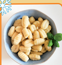
KLUSECZKI GNOCCHI 1 kg

Produkty głęboko mrożone, wstępnie przygotowane. Szybki czas przyrządzenia.