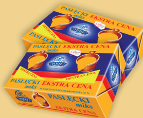
MIX PASŁĘCKI 200 g