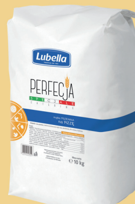
PERFECCJA MAKA NA PIZZĘ 10 kg