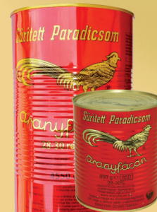
KONCENTRAT ZŁOTY BAŻANT 850 g / 4550 g