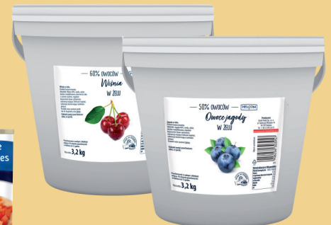
OWOCE W ŻELU WIŚNIA, JAGODA 3,2 kg