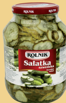
SAŁATKA SZWEDZKA 2500 g