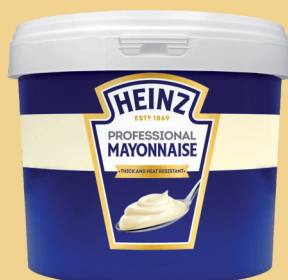
HEINZ MAJONEZ 5L