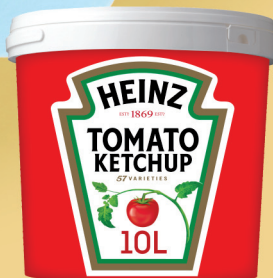
HEINZ KETCHUP 10L