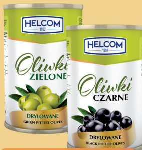
OLIWKI DRYLOWANE ZIEŁONE, CZARNE 4250 ml