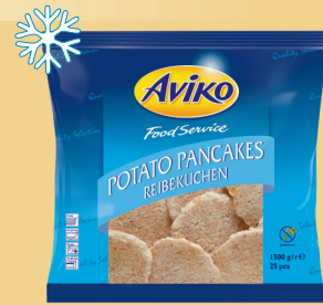
PLACKI ZIEMNIACZANE 1,5 kg

Produkty głęboko mrożone. Szybki czas przyrządzenia.