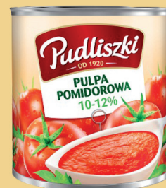
PULPA POMIDOROWA 2500 g