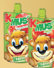
KUBUŚ MUS OWOCOWY 12 szt x 100 g