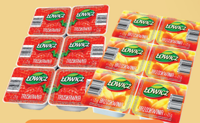
PRYSMAK OWOCOWY TRUSKAWKA, BRZOSKWINIA 30 x 25 g