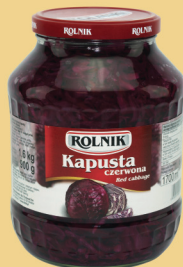
KAPUSTA CZERWONA 720 g