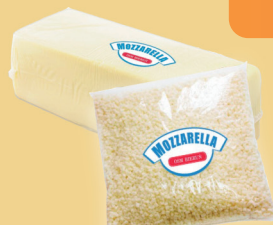
MOZZARELLA WIÓRKI / BLOK 2 kg / 1,5 kg