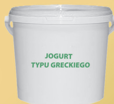
JOGURT TYPU GRECKIEGO 1 kg