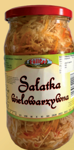
SAŁATKA WIELOWARZYWNA 900 ml