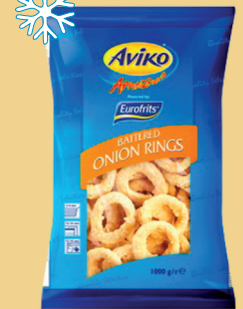
KRĄŻKI CEBULOWE 1 kg