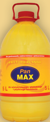
FRYTURA PŁYNNĄ 5L