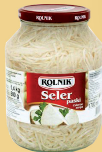
SELER PASZKI 1700 ml