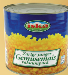
KUKURYDZA KONSERWOWA 2650 ml