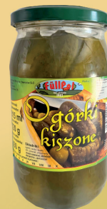
OGÓRKI KISZONE 900 ml