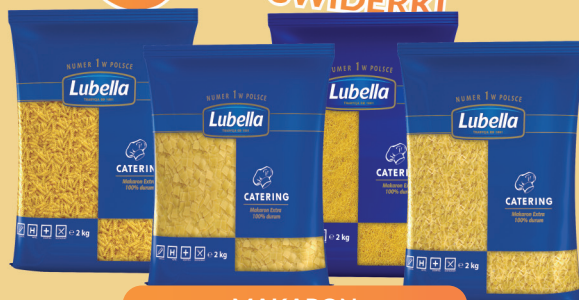
MAKARON ŚWIDERKI, KOKARDKI, NITKI, PIÓRA 2 kg