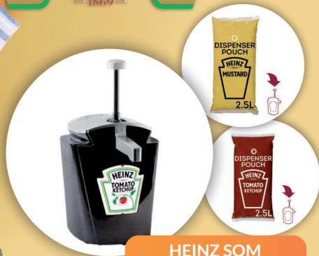
HEINZ SOM KETCHUP, MUSZTARDA 2,5 kg