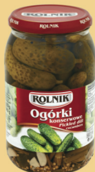
OGÓRKI KONSERWOWE 900 g