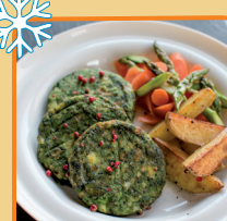
BURGER SZPINAKOWY 5 kg

O cenę pytaj swojego Przedstawiciela Handlowego.