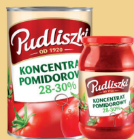
KONCENTRAT POMIDOROWY 195 g / 950 g