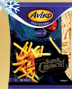
FRYTKI SUPER CHRUPIĄCE 9,5 mm 2,5 kg