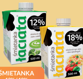
ŚMIETANKA 12% / 18% 500 ml