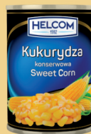
KUKURYDZA KONSERWOWA 425 ml