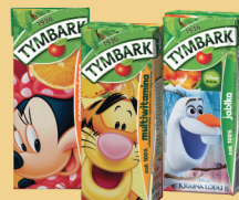
SOK 100% JABŁKO, POMARAŃCZA, MULTIWITAMINA 200 ml