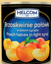
BRZOSKWINIE POŁÓWKI 2650 ml