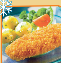
FILET RYBNY W CHRUPIACEJ PANIERCE 6 kg