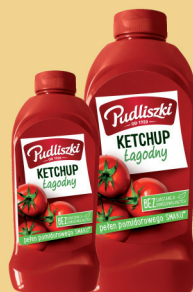
KETCHUP ŁAGODNY 480 g / 990 g