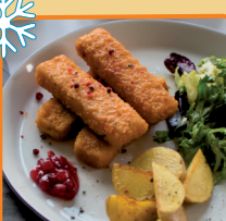
PALUSZKI RYBNE 900 g