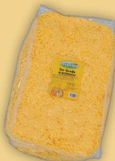
GOUDA WIÓRY 3 kg