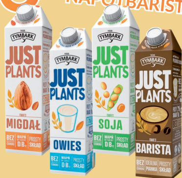
NAPÓJ JUST PLANTS OWIES, MIGDAŁ, SOJA, BARISTA 1 L